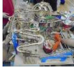
圖 1：多結構滾珠機器(範本)