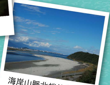
海岸山脈北端的嶺頂岬

臺灣在歐亞板塊與菲律賓海板塊碰撞下，於600萬年前開始露出海平面，島上優異發展的能量自此開始，到近代創造出多元的人、文、地、產、景風貌。過去10多年來，前經濟部中央地質調查所（現與礦務局整併為經濟部地質調查及礦業管理中心）為了強化社會大眾對國土地質的認知，除了推動地質環境教育，並以多元形式向民眾介紹地質旅遊路線或景點，帶領各界實際踩線體驗，藉此凸顯地方特色地質，期能對觀光旅遊產業及提振經濟發展有所助益。