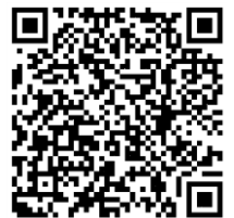
報名 QR code