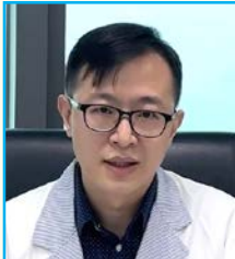
侯建州教授 管理心理學