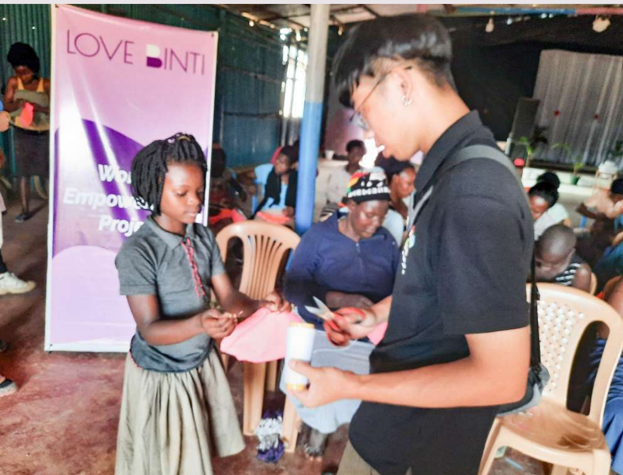
◀ 烏干達團隊夥伴教導當地民眾縫製布衛生棉