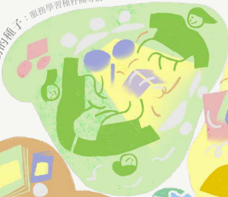
灌溉服務的種子：服務學習種子團專訪