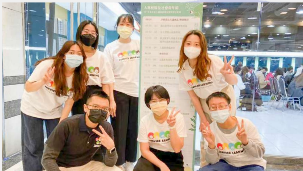
◀ V 落客團隊合影