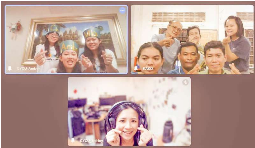
▲ 與當地組織 KAKO 員工線上合照