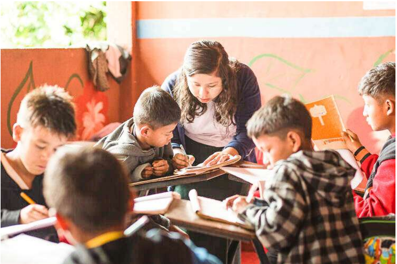
▲ 當地教師於上課期間中，在一旁協助學童們