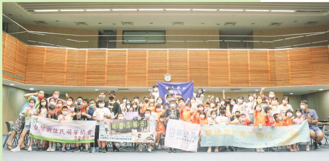
▼ 沒塑啦！種籽團「Fun 新」行動暑期營隊大合照