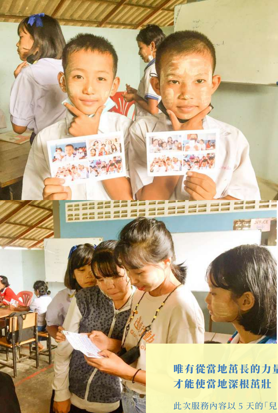
◀ 泰2班團員將營期照片製作成明信片，寫下祝福送到當地