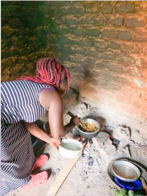
▲ 烏干達當地婦女於廚房煮飯