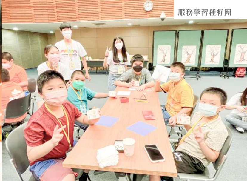
▲小朋友動手完成裝綠豆的牛奶盒作品