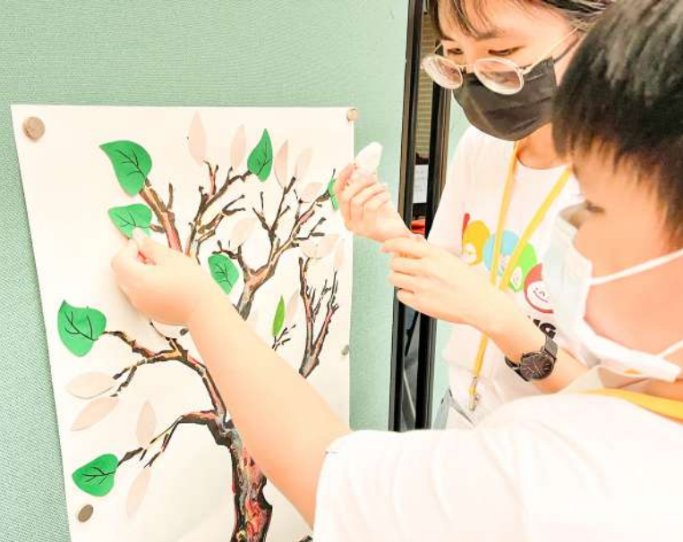
▲小朋友們將作為獎勵的樹葉貼紙貼在集點板上