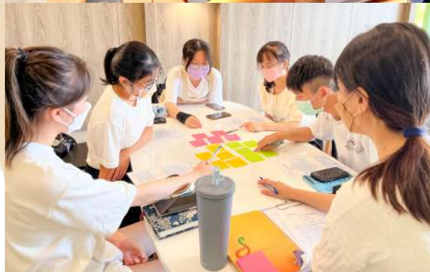
▲（上）記者團團隊例會時的合影 （下）記者團例會進行團隊服務反思