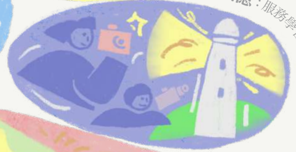
定格馬祖的回憶：服務學習V落客專訪