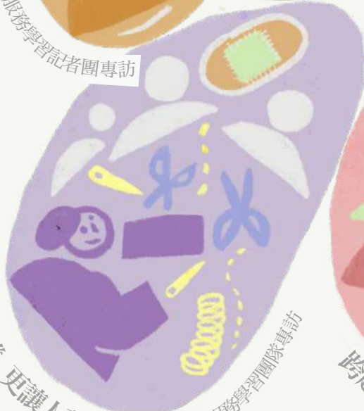
因為分離，更讓人珍惜：烏干達海外服務學習團隊專訪