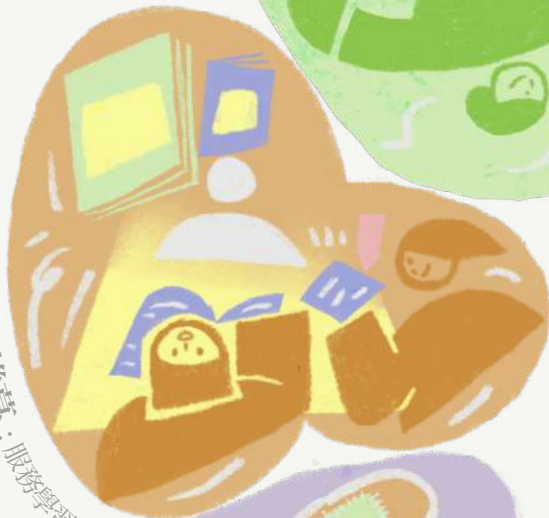
揭開故事的帷幕：服務學習記者團專訪