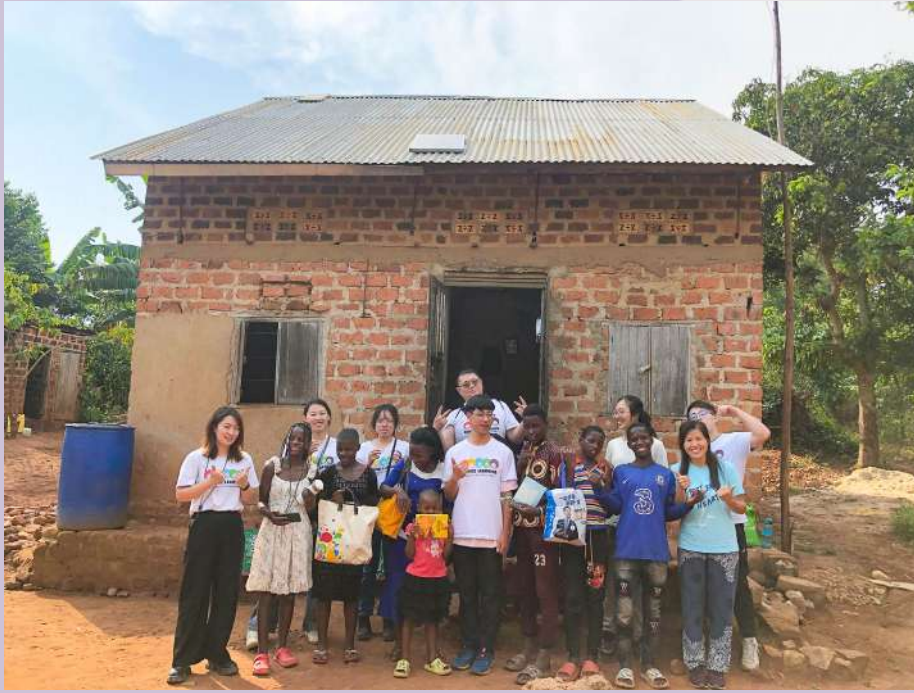
◀ 烏干達海外服務學習團隊與當地民眾合照