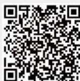
服務學習中心官網