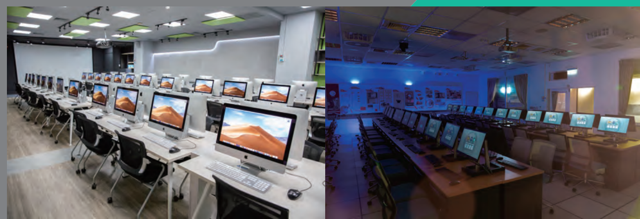
▶▶▶ MAC 影視特效後製電腦教室

本系與許多影視傳播、電腦動畫、電腦遊戲、AR 擴增與 VR 虛擬實境業者均有密切產學合作關係，如東森媒體集團、三立電視、民間全民電視、mono 親子台、台中捷運公司、映畫傳播、福相數位電影製作、凌雲傳播、乾坤一擊創意工作室、龍特創意、沌與設計、果島思設計工作室、...等，未來將繼續加強產學合作，與更多業者建立夥伴關係。