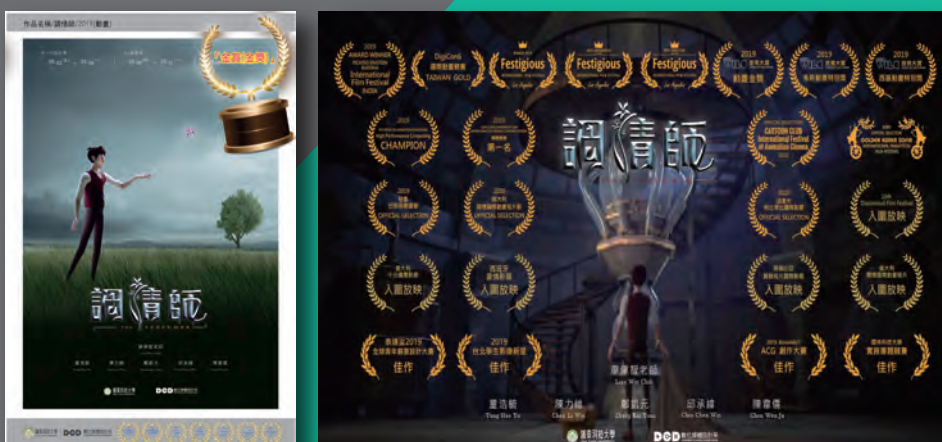
● 「調情師」3D 動畫學生作品屢創佳績，榮獲國內外多項比賽金獎、第一名、...等