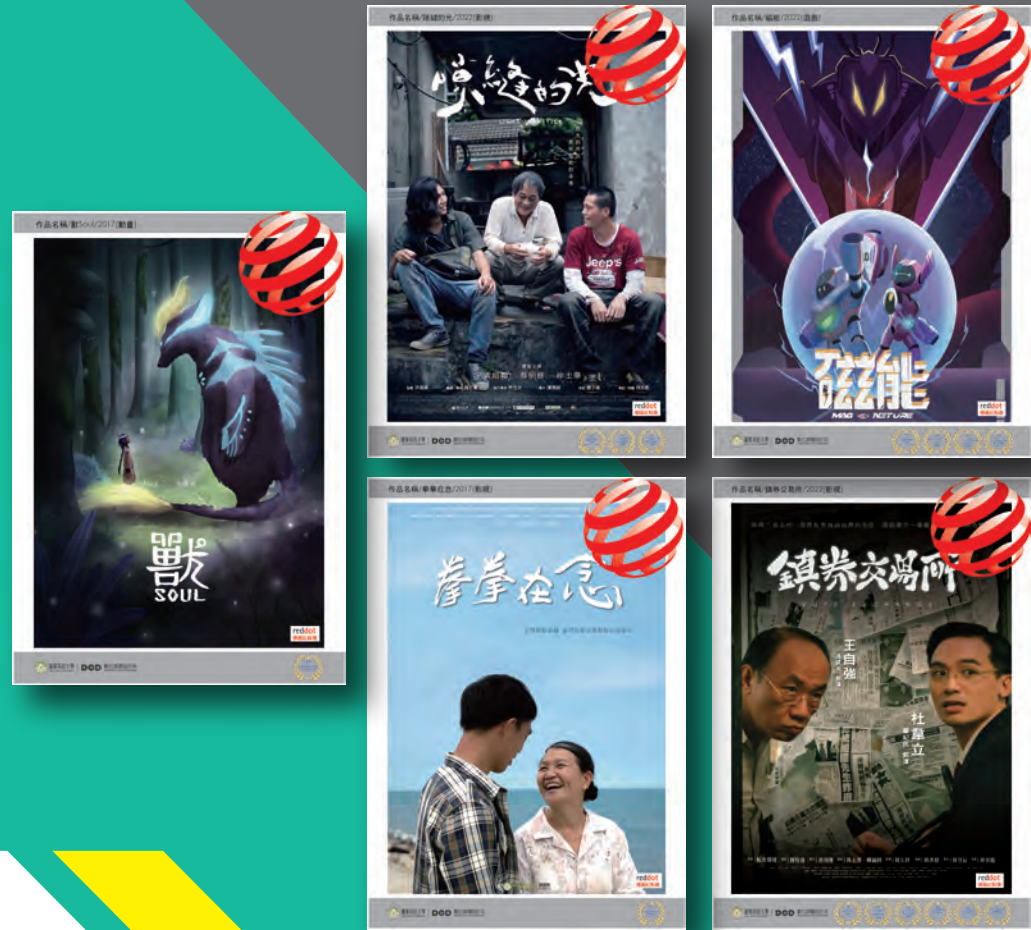
● 榮獲德國紅點設計獎項作品

DEPARTMENT OF DIGITAL CONTENT DESIGN DCD