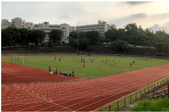
田徑場、足球場（400M、8跑道）