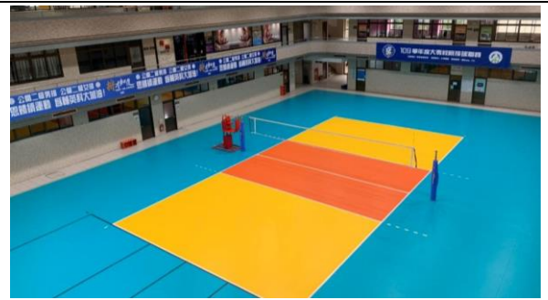
國際級排球場 LED燈光