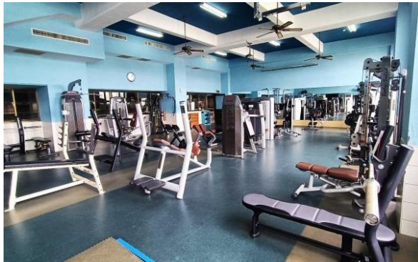
健身房-重量訓練室