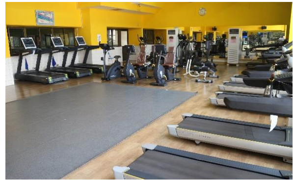
健身房-心肺功能室