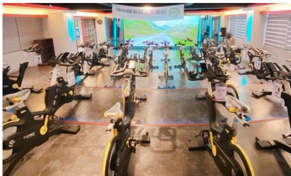
飛輪健身坊-500萬元打造/300場遊程