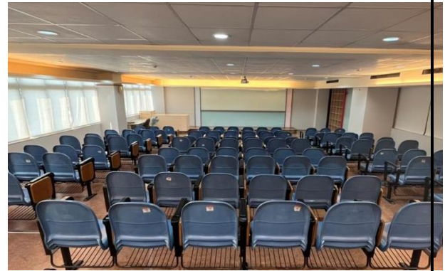
運動專業培訓基地（視廳教室/120人）