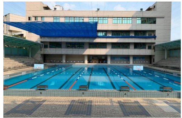
戶外游泳池（25M*20M、具遮陽功能）