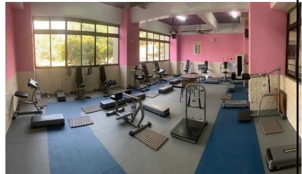
健身房-輕適能體能訓練室