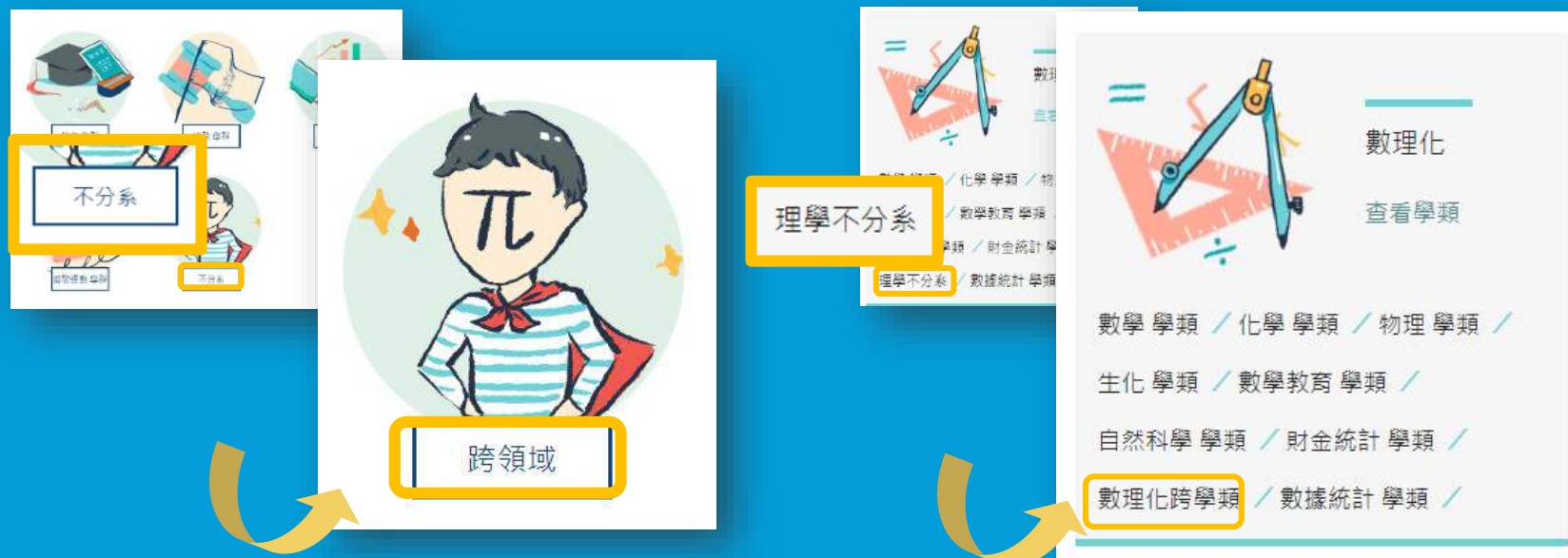
此頁為大學選才「認識學群」 - 「跨領域」

因應大學校系近年發展以跨域學習為主，調整原「不分系」名詞為「跨領域」。並將隸屬分類調整為「跨學類」。