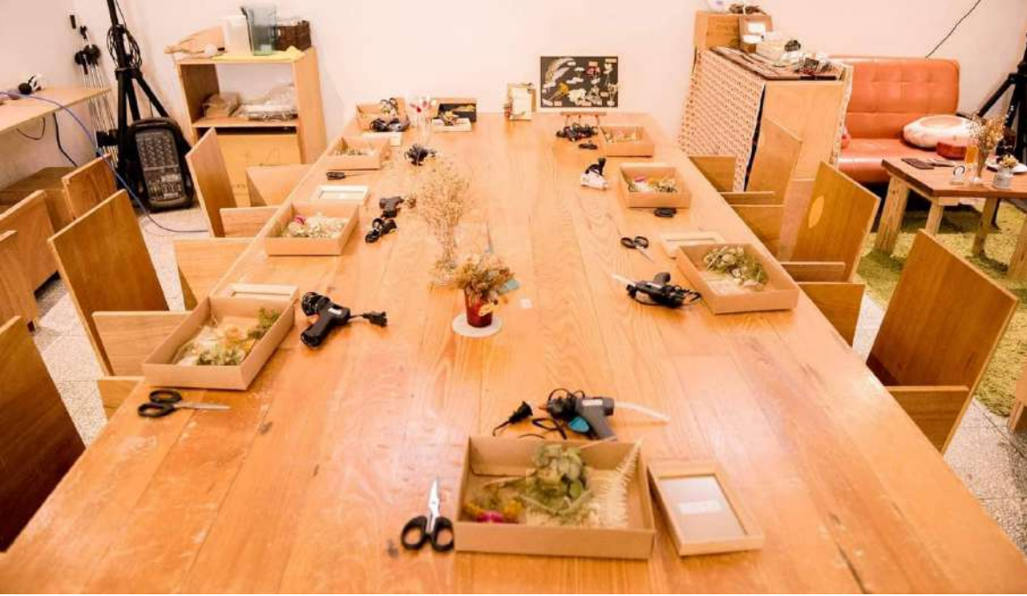
◀ 乾燥花製作課程也向店家借用空間辦理