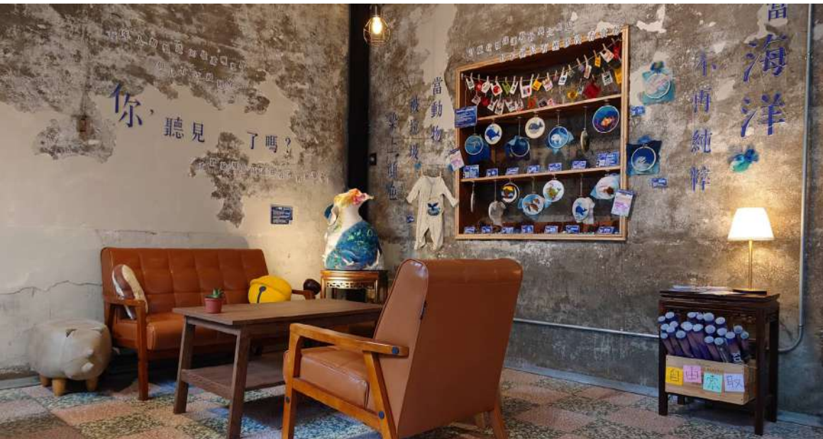
◀ 大觀小弄與賈桃樂學習主題館合作傳遞環保議題