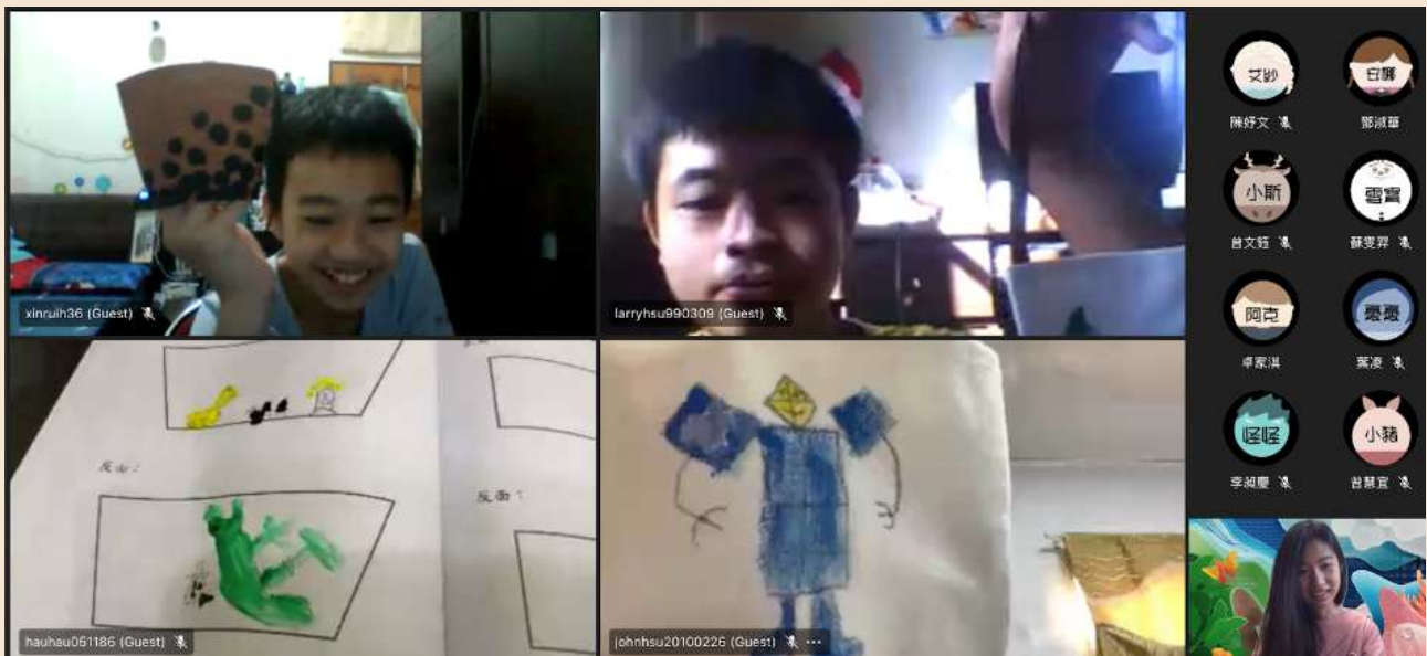
▲ 中原大學同學與大坡國中孩子們的美術課時間

當學生們從大學走入大坡國中，先前準備的萬無一失，似乎總有一失。在課程中做過無數的教案演練，盡可能地蒐集當地國中生的資料，邀請國中的老師、主任分享國中生學習的情況，設想各式可能遇到的問題，並想出相對應的解決方式，也因應疫情的關係，將營隊改為線上舉辦，而增加了許多課程設計的挑戰。經過一整個學期的打磨，大學生們懷著滿心期待，終於要將自己設計出的課程付諸實現，卻在一開始就碰壁了。對當地國中生來說，這群大哥哥大姊姊是完完全全的陌生人，自然就本能性地築起防衛心，再加上有些國中生並非自願參加，所以在一開始國中生們的投入與配合是沒有那麼理想的。而這樣的狀況也讓大學生們倍感挫折，產生自我懷疑，營隊期間突發狀況百出，雖然有些可能在課堂中提醒過，但 實際遇到跟聽到的描述還是不太一樣，這也是親自走入服務現場才能體會到的。