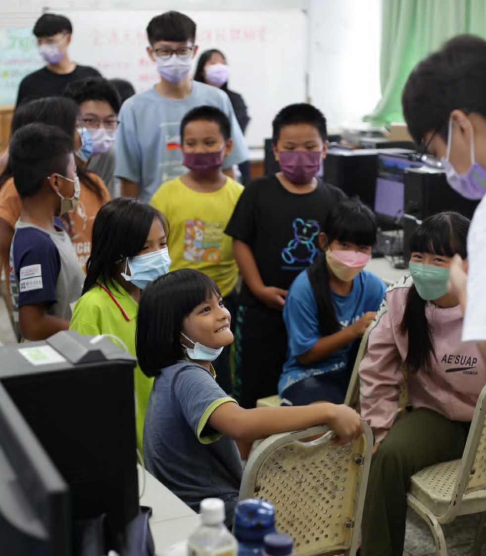
▲ 大哥哥們與小朋友們一起聊天