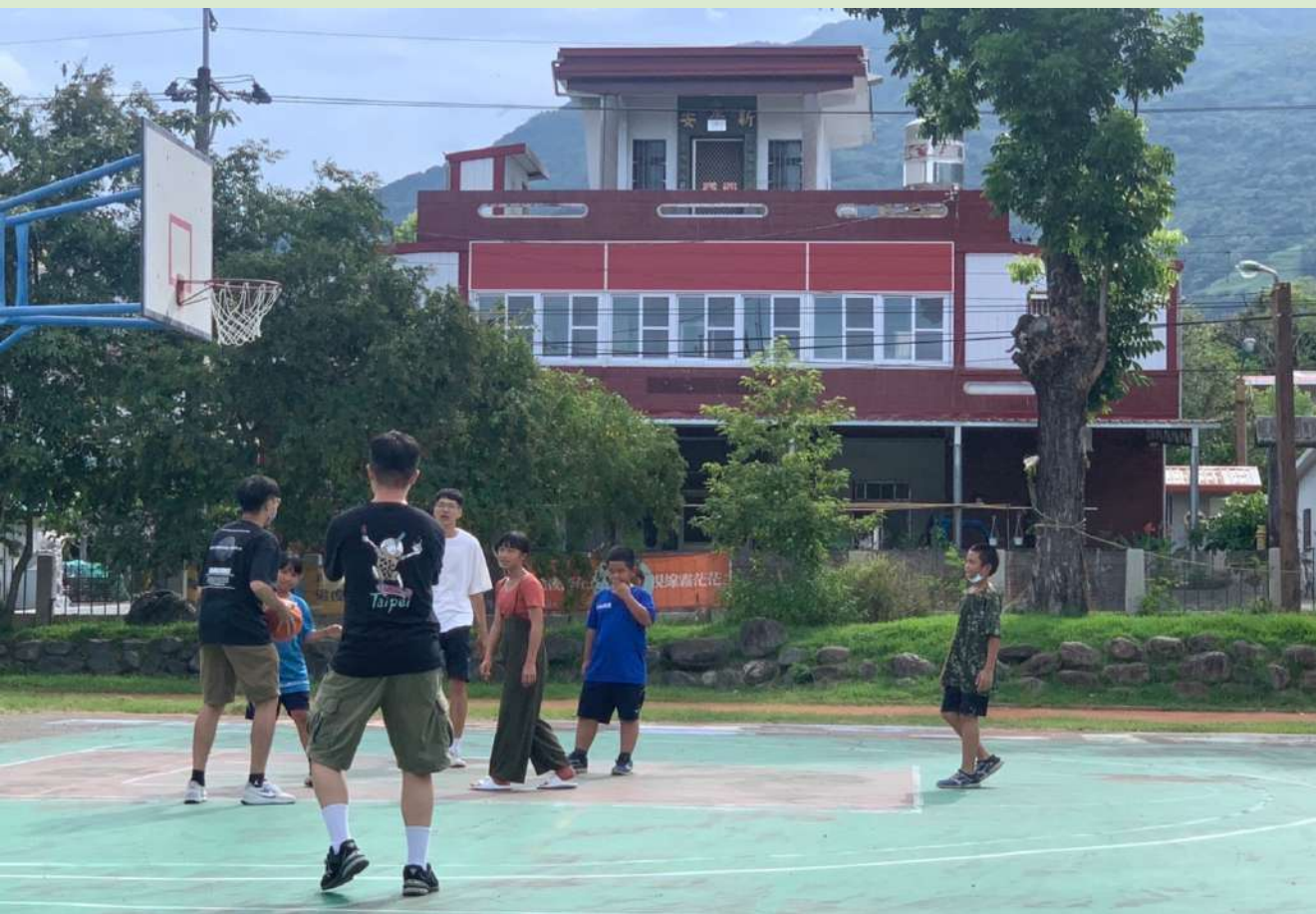
◀ 下課時間小朋友們與大哥哥們的籃球時光

聊天的過程當中，小朋友們提到自己很會打籃球，言語之間難掩他們對籃球的喜愛。「我們打籃球很厲害嘞！」「真的哦，我們有哥哥是打系籃的！」「那我們來比賽吧！」被小朋友拉著手，帶到了籃球場，下課的時光，變成了體育課，大家一起打起了籃球。