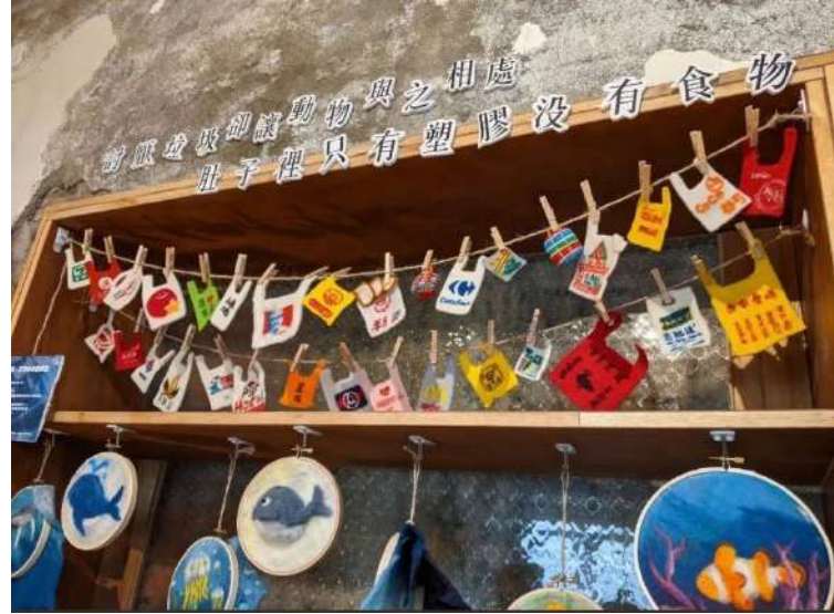
▲ 環保議題牆面細圖

到了採訪尾聲，又到了分別的時間點，在推開門扉走出店面的瞬間，小記者下意識問了老闆自己心中的疑惑：「雖然很想再更瞭解大觀園中承載的歷史，但總是會擔心一味的好奇探索造成附近住戶的困擾。」面對小記者突如其來的想法，老闆告訴了小記者，不只有大觀小弄，大觀園中的烏園、瓦溝橋，好多好多的空間其實都暗藏著屬於它們的歷史故事。與其坐著說自己多麼好奇，不如就主動去跟附近的居民互動和聊天，大家其實都不藏私，很樂意分享自己的經歷，就像老闆前面提及： 我們就像是個容器，裝載著許多內容，你進到裡頭想要收穫些甚麼，可以自己去選擇。 語畢，小記者走出店門，一次又一次的在觀園內穿梭，走到一名坐在烏園歇息的老人面前，開口說道：「您好，我是中原服務學習記者團的小記者，我很好奇……」