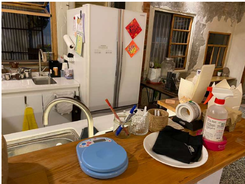
◀ 店內使用家用冰箱而非甜點櫃

大觀小弄是一間注重環保議題的店家，店內的甜點包裝都是堅持用紙餐盒進行減塑，而且大觀小弄沒有「甜點櫃」。有些顧客進到店內也會好奇為甚麼沒有安裝甜點櫃，讓人可以輕易挑選自己想吃的款式。老闆表示，因為甜點櫃的耗電量是一般家電冰箱的好幾倍，如果今天為了美觀使用甜點櫃，將會造成很大的能源消耗，這不是店家所樂見的。因此，即使今天顧客必須使用手機觀看IG的限時動態來挑選喜歡的產品，老闆還是覺得，如果能因此減少些許耗能，一切都是有意義的。老闆在採訪中跟小記者說道：「 有些東西它其實是一個選擇，不能讓每個人都去配合你的價值觀。 」推廣議題不能硬性地要求他人跟進，如果不能讓對方也瞭解到其中的意義，即使今天對方在我們眼前乖乖遵守，離開視線後他們逆著做了多少回我們都不知道。因此，老闆表示不會強迫他人跟著自己的環保理念走，但會用在店內的環保行動讓對方知道自己有這個選擇，用靜態的方式招來同道中人，就像姜太公釣魚一般。