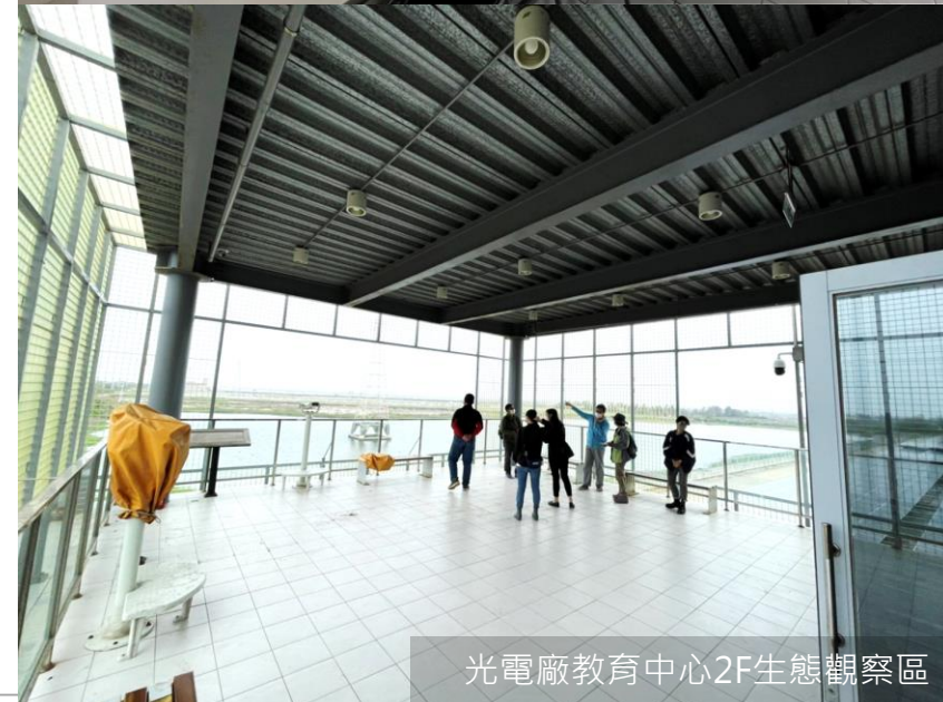
光電廠教育中心2F生態觀察區