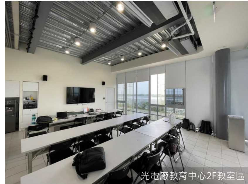
光電廠教育中心2F教室區