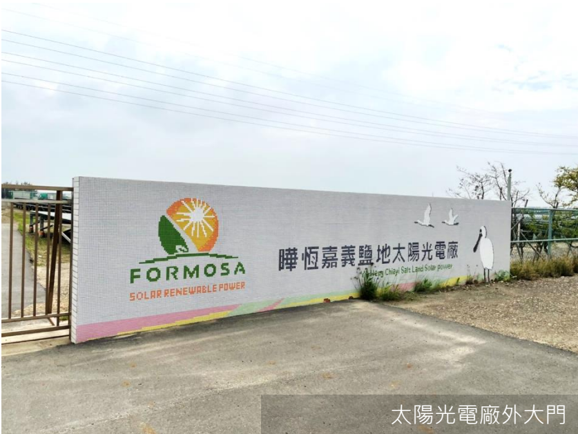
太陽光電廠外大門