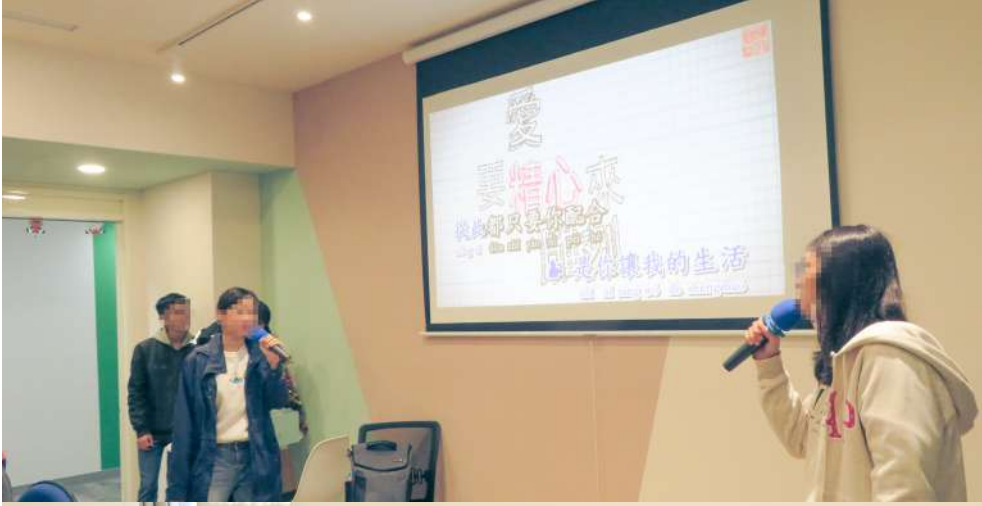
天使學伴主題活動！特資杯趣味PK競賽