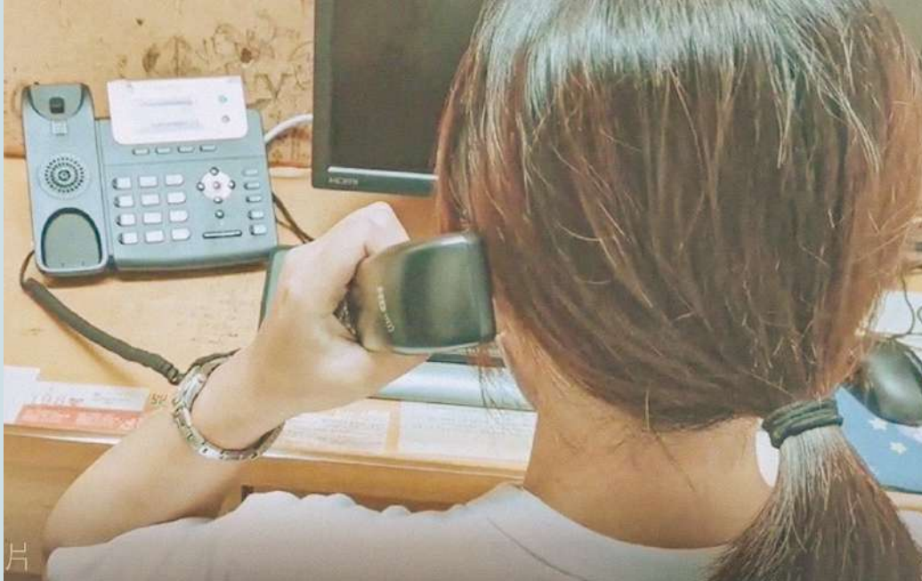
張老師 1980 專線服務