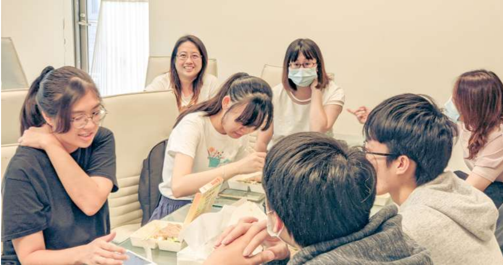
天使學伴與老師們的督導討論