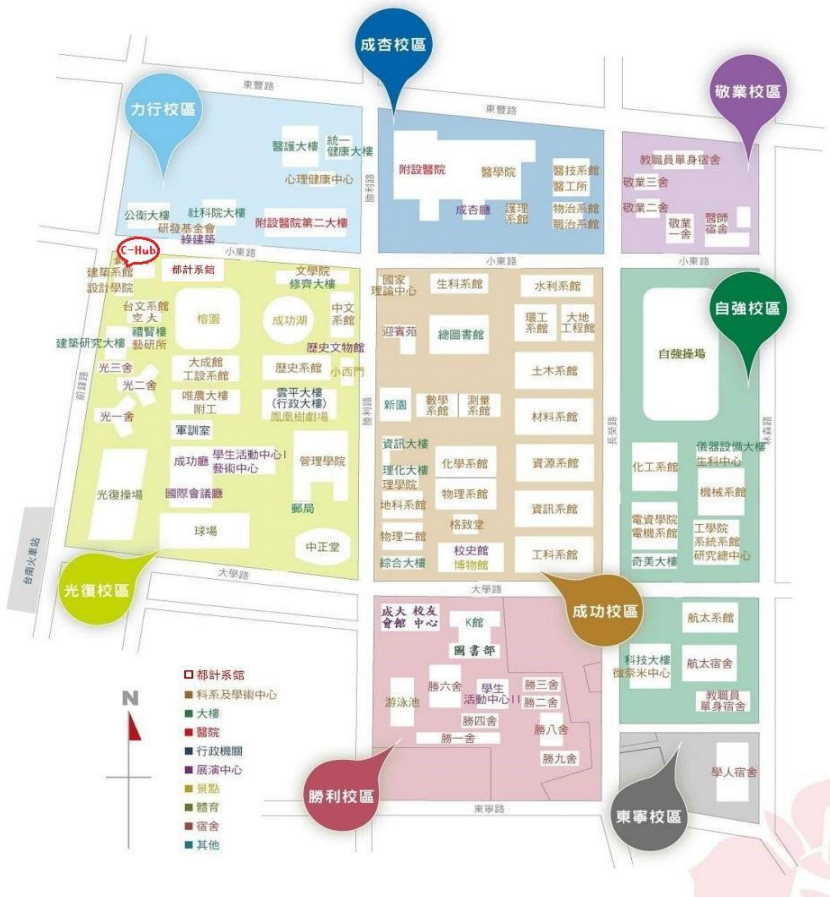
圖 1-C-Hub 創意基地位置圖