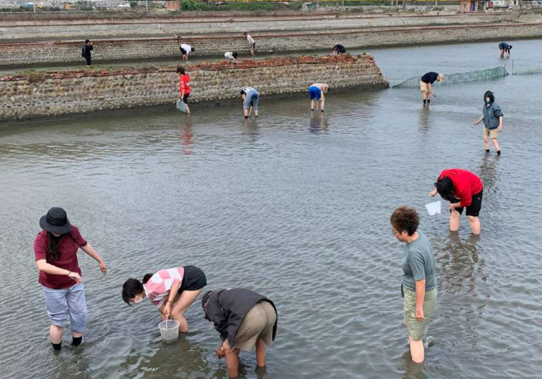
◀ 環境調查實習中，同學們下水體驗漁民撿拾蛤蜊的辛苦。