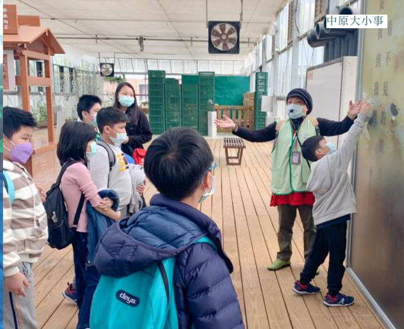
▲ 新二代孩童專心聆聽環保概念的解說。