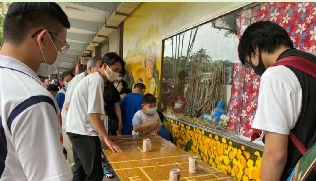
◀ 景觀設計課程中，同學們設計遊戲和國小學生互動。

課程中另外一組的學生，在當地環境中發現了水污染的問題。並在討論後認為水污染應該從根本解決，但這項議題卻超乎他們想像的巨大。雖然無法立即處理污染問題，但學生們也提出了「製作環境教育材料」這項想法，利用拍影片和製作繪本的方式為當地孩童建立正確的保育水資源觀念，提高他們的環保自覺性。這兩則故事都讓我們看見了地景建築系學生在這堂課程中的行動力以及克服問題的過程，正因為重視所觀察的環境，才能想出實際且有效的改善方案。