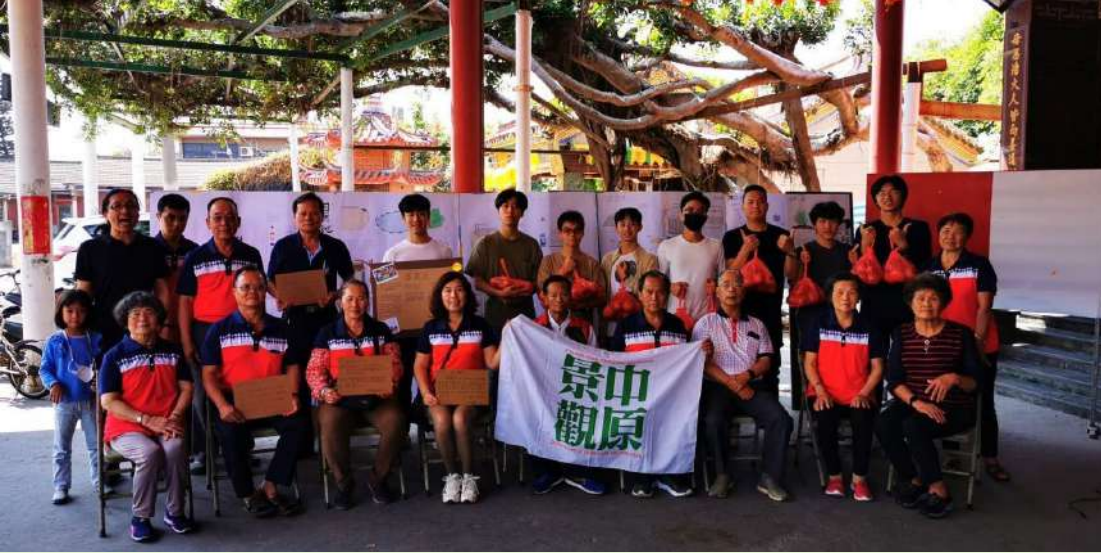
◀ 環境調查實習課程中的服務大合照。