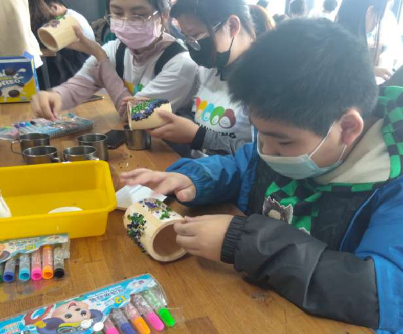
▲ 新二代孩童以海洋廢棄物再製成的玻璃砂裝飾筆筒。