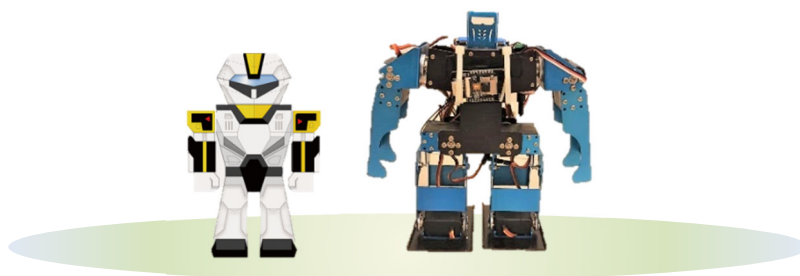
<A 班學員可帶回摺紙機器人>