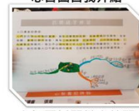
心智圖抓關鍵字練習