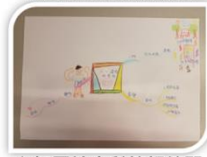
心智圖社會科筆記練習