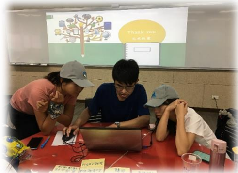
教案活動設計指引撰述