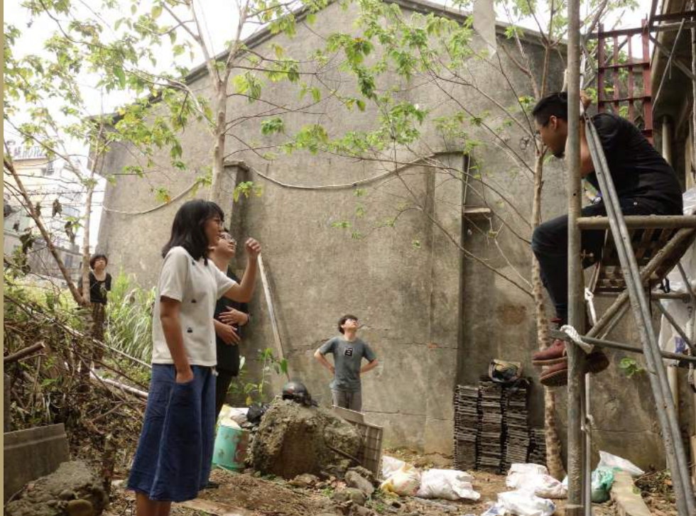
▲ 火車看台的打造。重建者老們過往的回憶。

每個地方都需要做夢的人， 但當這個夢想一直提出去， 卻沒有辦法被實現的時候， 那就會很痛苦， 也是我們離職的原因。