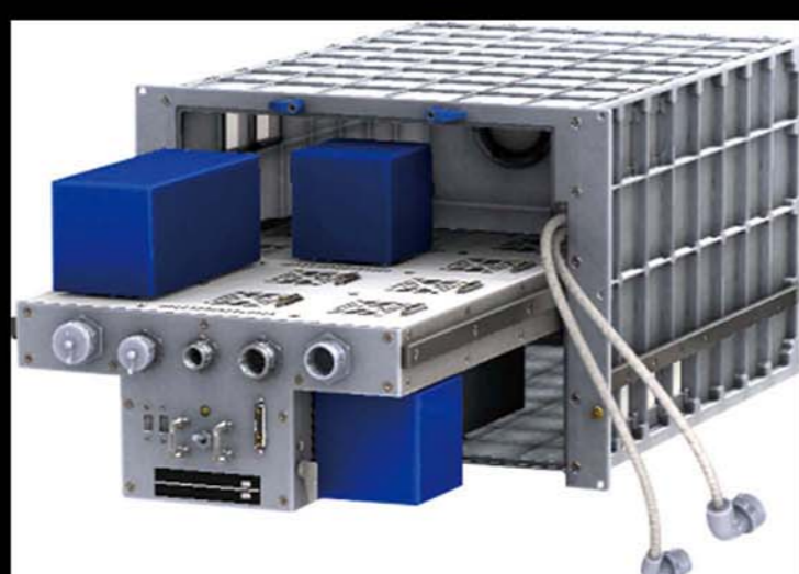
ESA ICE Cubes