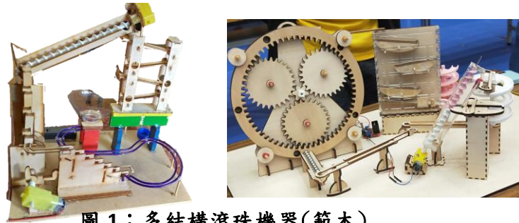
圖 1：多結構滾珠機器(範本)