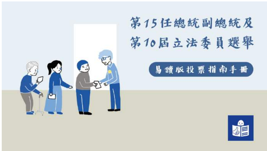
總統與副總統+立法委員選舉投票動線圖

這本手冊主要是提供給智能障礙者、文字閱讀能力有困難的人所使用的易讀版投票說明手冊,說明民國 109 年 1 月 11 日第 15 任總統副總統及第 10 屆立法委員選舉的投票流程,以及相關的重要資訊。