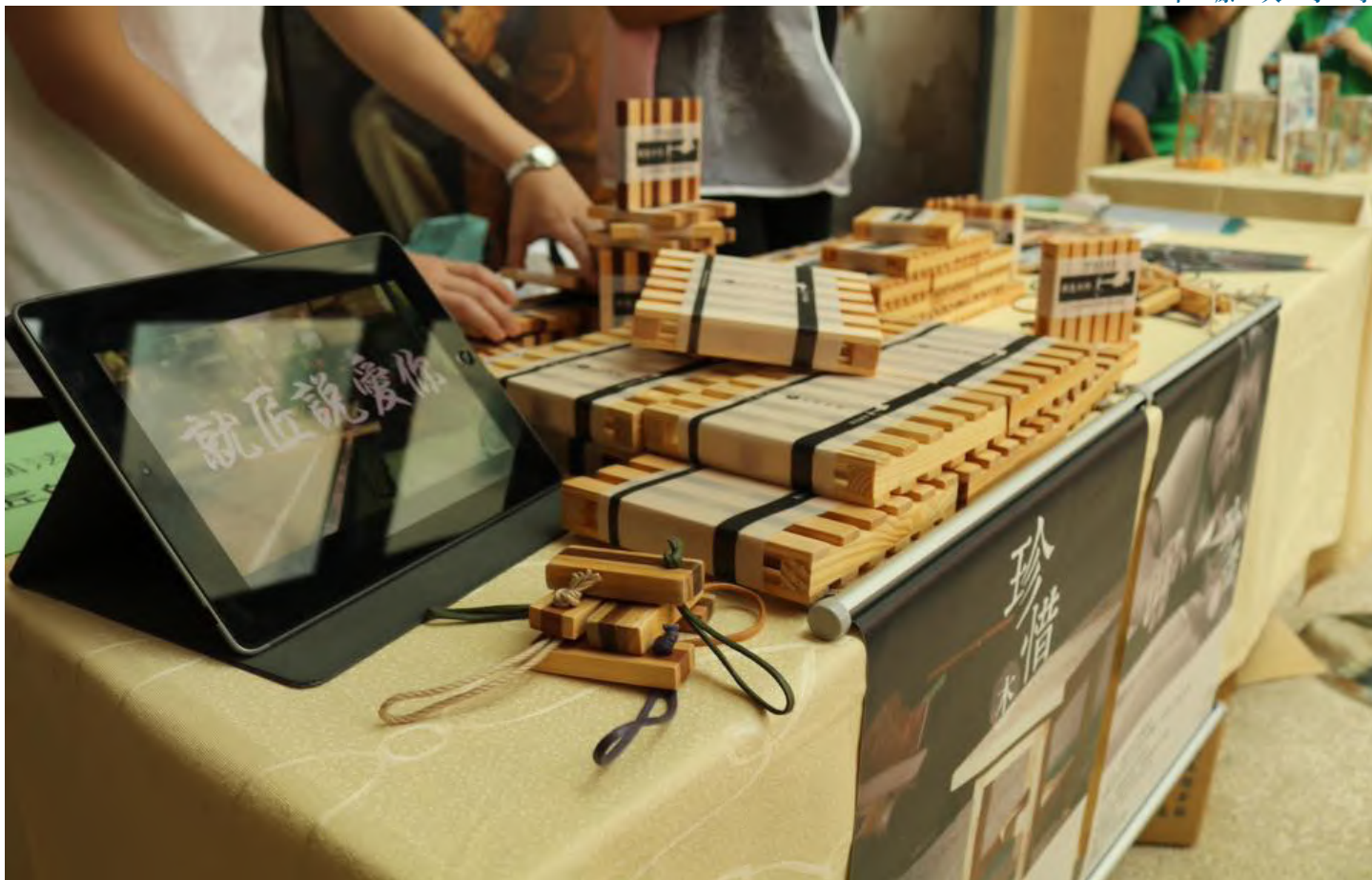
01 販售拼木杯墊的市集現場