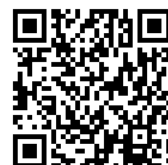
木匠的家粉絲專頁

木匠的家成立於 1999 年，並於 2004 年增設「木匠的家公益二手店」。透過回收民眾家中淘汰的家具、物品，並雇用弱勢朋友進行修復及協助販賣，至今已修復數萬件家具，提供 225 名弱勢朋友工作機會，更輔導了將近百人重回職場就業。