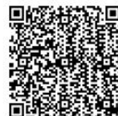
怡仁基金會粉絲專頁

加入怡仁愛心基金會粉絲專頁追蹤最新消息： https://www.facebook.com/yijen02488772/