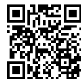
中原基層文化服務團粉絲專頁

黃金考驗營是於期中考後一兩週，在桃園區的小學舉辦兩天一夜的營隊活動，體驗一日小隊輔；寒暑營則為期兩個星期並以教育優先區的國小學童為主。以主題式營隊為主，例如科學實驗營、客家文化營及美語營等。不只帶給小朋友歡樂，也思考如何帶給小朋友更多意義。