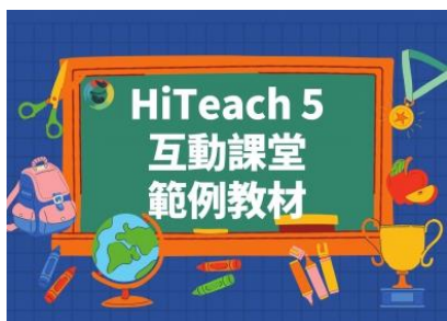
互動課堂範例教材