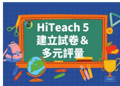
建立試卷&多元評量