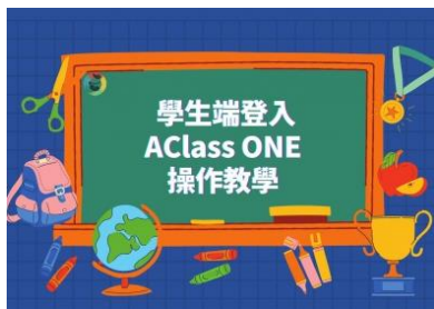
Aclass ONE 操作教學