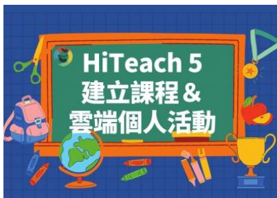
建立課程&雲端個人活動